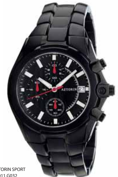
AZTORIN SPORT A011.G032

Koperta stalowa o średnicy 44,5 mm, czarna, wskazówkowy mechanizm kwarcowy, chronograf, datownik, szkło szafirowe, bransoleta stalowa, czarna, wodoszczelność do 100 m.