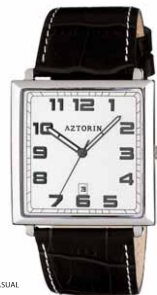
AZTORIN CASUAL A021.G068

Koperta stalowa o wymiarach 44 x 38 mm, wskazówkowy mechanizm kwarcowy, datownik, szkło szafirowe, pasek skórzany, wodoodporność do 30 m.