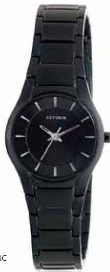
AZTORIN CLASSIC A014.L042

Zegarek damski, koperta stalowa o średnicy 26 mm, czarna, wskazówkowy mechanizm kwarcowy, szkło szafirowe, bransoleta stalowa, czarna, wodoodporność do 50 m.