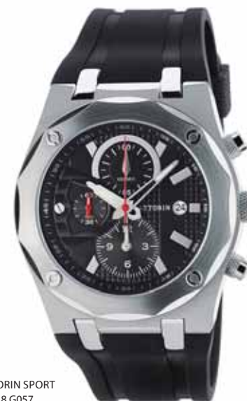
AZTORIN SPORT A018.G057

Koperta stalowa o średnicy 43 mm, wskazówkowy mechanizm kwarcowy, chronograf, datownik, szkło szafirowe, pasek kauczukowy, wodoszczelność do 100 m.