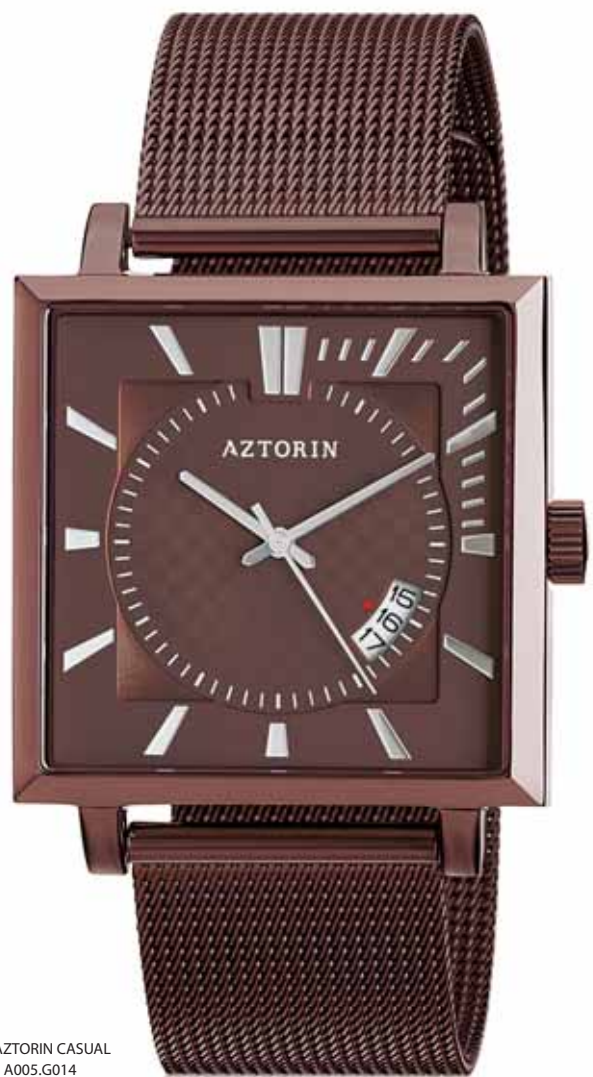
AZTORIN CASUAL A005.G014

Koperta stalowa o wymiarach 47 x 37,3 mm, brązowa, wskazówkowy mechanizm kwarcowy, datownik, szkło szafirowe, bransoleta stalowa, brązowa, wodoodporność do 30 m.