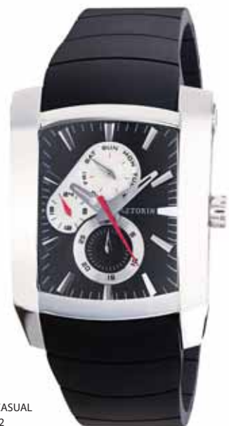
AZTORIN CASUAL A016.G052

Koperta stalowa o wymiarach 49,3 x 37 mm, wskazówkowy mechanizm kwarcowy, datownik, wskazania dni tygodnia, szkło szafirowe, pasek kauczukowy, wodoszczelność do 100 m.