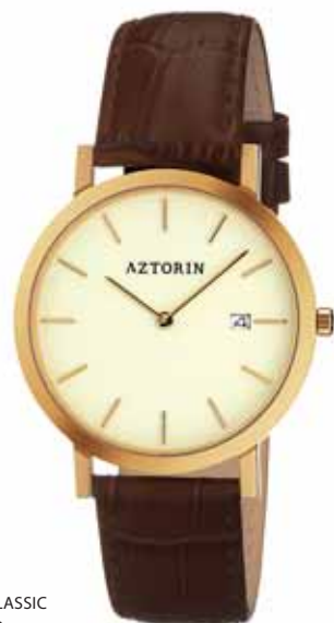
AZTORIN CLASSIC A023.G078

Koperta stalowa o średnicy 36,8 mm, pozłacana, wskazówkowy mechanizm kwarcowy, datownik, szkło szafirowe, pasek skórzany, wodoszczelność do 30 m.