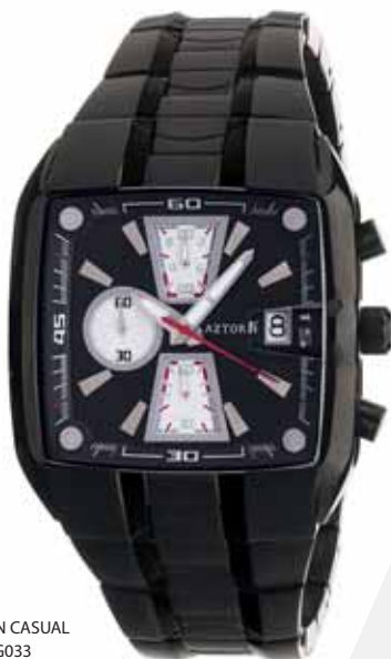
AZTORIN CASUAL A012.G033

Koperta stalowa o wymiarach 50 x 42 mm, wskazówkowy mechanizm kwarcowy, chronograf, datownik, szkło szafirowe, bransoleta stalowa, czarna, wodoszczelność do 100 m.