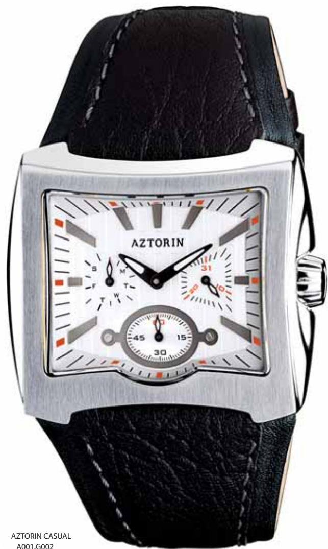
AZTORIN CASUAL A001.G002

Koperta stalowa o wymiarach 39,8 x 41,8 mm, wskazówkowy mechanizm kwarcowy, datownik, wskazania dni tygodnia, szkło szafirowe, pasek skórzany, wodoszczelność do 100 m.