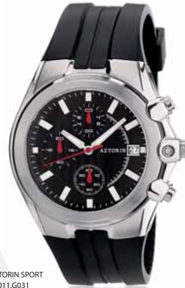
AZTORIN SPORT A011.G031

Koperta stalowa o średnicy 44,5 mm, wskazówkowy mechanizm kwarcowy, chronograf, datownik, szkło szafirowe, pasek kauczukowy, wodoszczelność do 100 m.