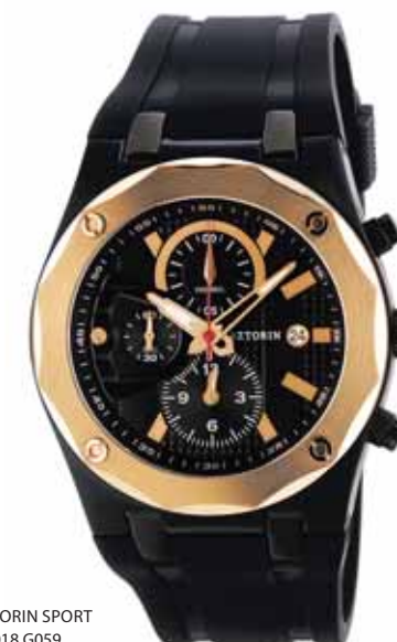
AZTORIN SPORT A018.G059

Koperta stalowa o średnicy 43 mm, czarna, pierścień pozłacany, wskazówkowy mechanizm kwarcowy, chronograf, datownik, szkło szafirowe, pasek kauczukowy, wodoszczelność do 100 m.