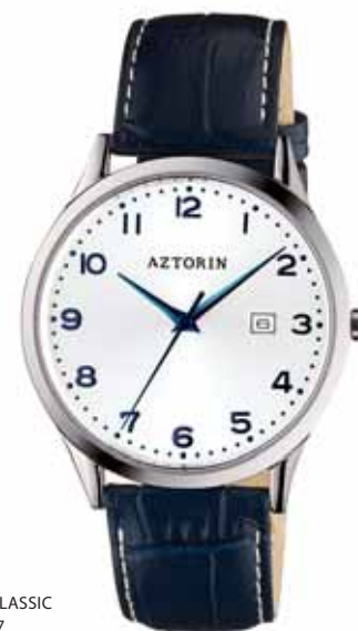
AZTORIN CLASSIC A026.G087

Koperta stalowa o średnicy 39,3 mm, wskazówkowy mechanizm kwarcowy, datownik, szkło szafirowe, pasek skórzany, wodoszczelność do 50 m.