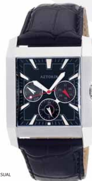
AZTORIN CASUAL A008.G022

Koperta stalowa o wymiarach 48,8 x 37 mm, wskazówkowy mechanizm kwarcowy, datownik, wskazania dni tygodnia, szkło szafirowe, pasek skórzany, wodoszczelność do 100 m.