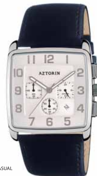
AZTORIN CASUAL A029.G097

Koperta stalowa o wymiarach 43,8 x 37 mm, wskazówkowy mechanizm kwarcowy, datownik, chronograf, szkło szafirowe, pasek satynowy, wodoszczelność do 30 m.