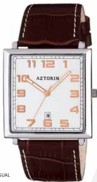
AZTORIN CASUAL A021.G066

Koperta stalowa o wymiarach 44 x 38 mm, wskazówkowy mechanizm kwarcowy, datownik, szkło szafirowe, pasek skórzany, wodoodporność do 30 m.