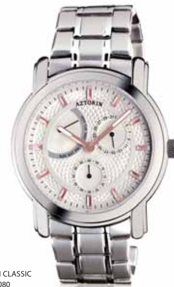
AZTORIN CLASSIC A024.G080

Koperta stalowa o średnicy 41,8 mm, wskazówkowy mechanizm kwarcowy, datownik, wskazania dni tygodnia, szkło szafirowe, bransoleta stalowa, wodoodporność do 50 m.