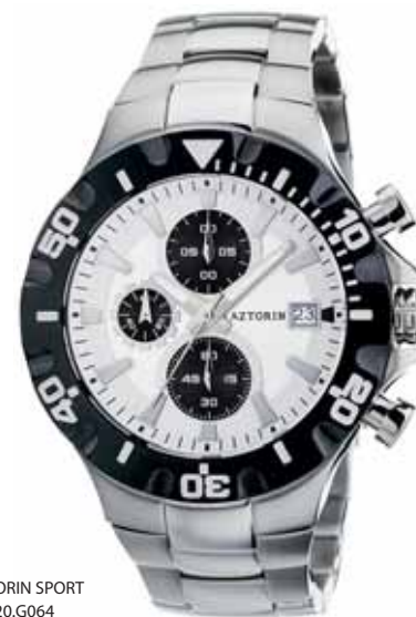
AZTORIN SPORT A020.G064

Koperta stalowa o średnicy 44 mm, pierścień czarny, wskazówkowy mechanizm kwarcowy, chronograf, datownik, szkło szafirowe, bransoleta stalowa, wodoszczelność do 100 m.