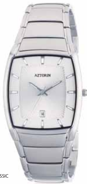
AZTORIN CLASSIC A009.G026

Koperta stalowa o wymiarach 42,5 x 34,4 mm, wskazówkowy mechanizm kwarcowy, datownik, szkło szafirowe, bransoleta stalowa, wodoodporność do 30 m.