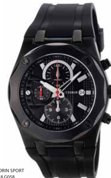
AZTORIN SPORT A018.G058

Koperta stalowa o średnicy 43 mm, czarna, wskazówkowy mechanizm kwarcowy, chronograf, datownik, szkło szafirowe, pasek kauczukowy, wodoszczelność do 100 m.