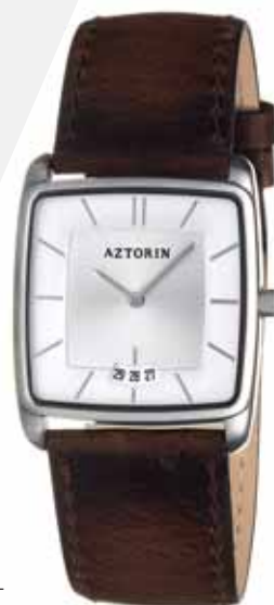
AZTORIN CASUAL A030.L102

Zegarek damski, koperta stalowa o wymiarach 36,5 x 30 mm, wskazówkowy mechanizm kwarcowy, datownik, szkło szafirowe, pasek skórzany, wodoszczelność 30 m.