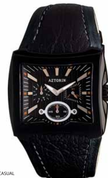
AZTORIN CASUAL A001.G001

Koperta stalowa o wymiarach 39,8 x 41,8 mm, wskazówkowy mechanizm kwarcowy, datownik, wskazania dni tygodnia, szkło szafirowe, pasek skórzany, wodoszczelność do 100 m.