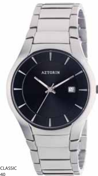
AZTORIN CLASSIC A014.G040

Koperta stalowa o średnicy 40 mm, wskazówkowy mechanizm kwarcowy, datownik, szkło szafirowe, bransoleta stalowa, wodoodporność do 100 m.