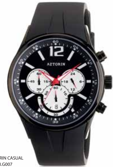
AZTORIN CASUAL A003.G007

Koperta stalowa o średnicy 43,6 mm, czarna, wskazówkowy mechanizm kwarcowy, chronograf, datownik, szkło szafirowe, pasek kauczukowy, wodoszczelność do 100 m.