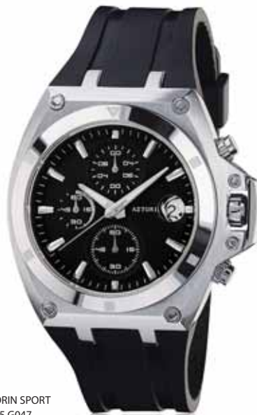
AZTORIN SPORT A015.G047

Koperta stalowa o średnicy 42 mm, wskazówkowy mechanizm kwarcowy, chronograf, datownik, szkło szafirowe, pasek kauczukowy, wodoodporność do 100 m.