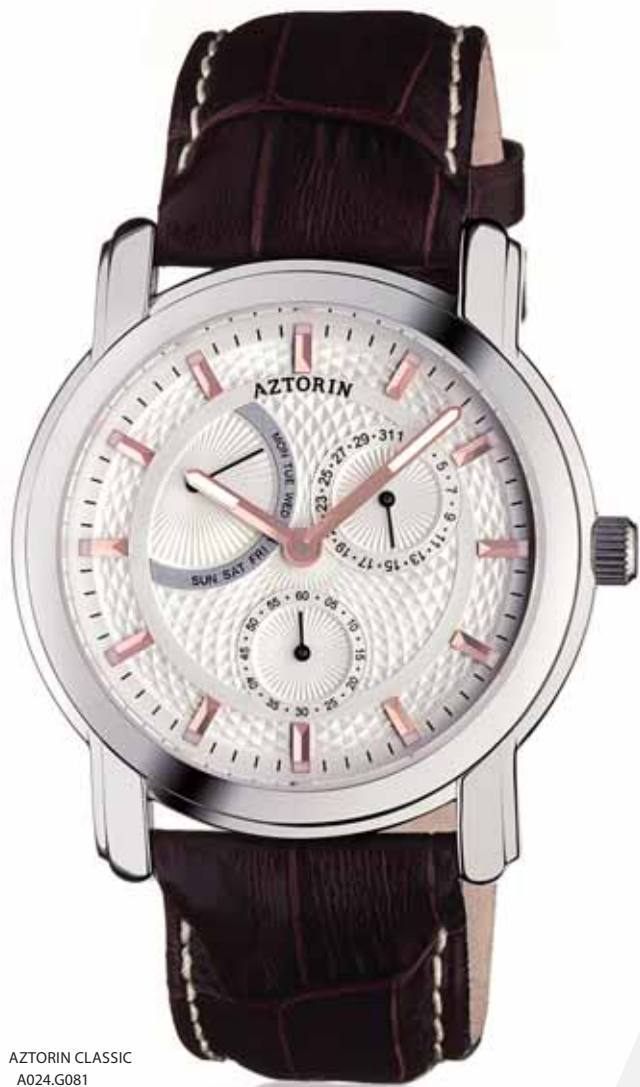
AZTORIN CLASSIC A024.G081

Koperta stalowa o średnicy 41,8 mm, wskazówkowy mechanizm kwarcowy, datownik, wskazania dni tygodnia, szkło szafirowe, pasek skórzany, wodoodporność do 50 m.