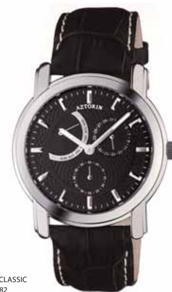
AZTORIN CLASSIC A024.G082

Koperta stalowa o średnicy 41,8 mm, wskazówkowy mechanizm kwarcowy, datownik, wskazania dni tygodnia, szkło szafirowe, pasek skórzany, wodoodporność do 50 m.