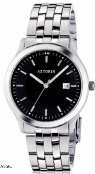
AZTORIN CLASSIC A027.G093

Koperta stalowa o średnicy 38,8 mm, wskazówkowy mechanizm kwarcowy, datownik, szkło szafirowe, bransoleta stalowa, wodoszczelność do 50 m.