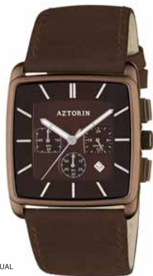
AZTORIN CASUAL A029.G101

Koperta stalowa o wymiarach 43,8 x 37 mm, brązowa, wskazówkowy mechanizm kwarcowy, chronograf, datownik, szkło szafirowe, pasek skórzany, wodoszczelność 30 m.