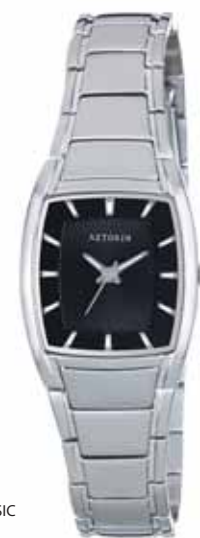
AZTORIN CLASSIC A009.L027

Zegarek damski, koperta stalowa o wymiarach 30,4 x 23,4 mm, wskazówkowy mechanizm kwarcowy, szkło szafirowe, bransoleta stalowa, wodoodporność do 30 m.