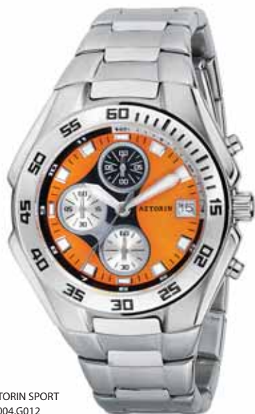
AZTORIN SPORT A004.G012

Koperta stalowa o średnicy 43 mm, wskazówkowy mechanizm kwarcowy, chronograf, datownik, szkło szafirowe, bransoleta stalowa, wodoszczelność do 100 m.