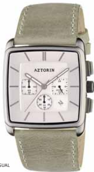
AZTORIN CASUAL A029.G099

Koperta stalowa o wymiarach 43,8 x 37 mm, wskazówkowy mechanizm kwarcowy, chronograf, datownik, szkło szafirowe, pasek skórzany, wodoszczelność 30 m.