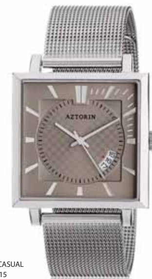
AZTORIN CASUAL A005.G015

Koperta stalowa o wymiarach 47 x 37,3 mm, wskazówkowy mechanizm kwarcowy, datownik, szkło szafirowe, bransoleta stalowa, wodoodporność do 30 m.