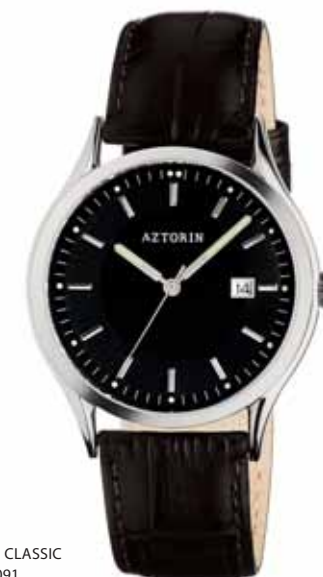
AZTORIN CLASSIC A027.G091

Koperta stalowa o średnicy 38,8 mm, wskazówkowy mechanizm kwarcowy, datownik, szkło szafirowe, pasek skórzany, wodoszczelność do 50 m.