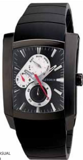
AZTORIN CASUAL A016.G050

Koperta stalowa o wymiarach 49,3 x 37 mm, czarna, wskazówkowy mechanizm kwarcowy, datownik, wskazania dni tygodnia, szkło szafirowe, pasek kauczukowy, wodoszczelność do 100 m.