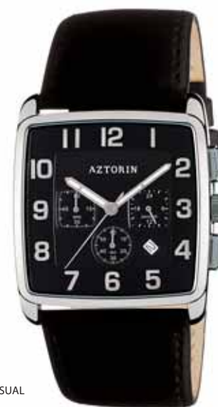
AZTORIN CASUAL A029.G100

Koperta stalowa o wymiarach 43,8 x 37 mm, wskazówkowy mechanizm kwarcowy, datownik, chronograf, szkło szafirowe, pasek satynowy, wodoszczelność do 30 m.