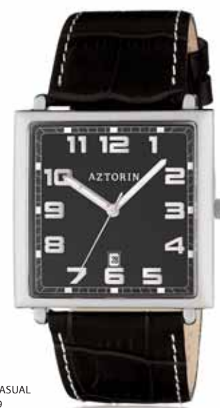
AZTORIN CASUAL A021.G069

Koperta stalowa o wymiarach 44 x 38 mm, wskazówkowy mechanizm kwarcowy, datownik, szkło szafirowe, pasek skórzany, wodoodporność do 30 m.