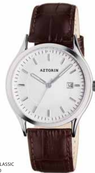
AZTORIN CLASSIC A027.G090

Koperta stalowa o średnicy 38,8 mm, wskazówkowy mechanizm kwarcowy, datownik, szkło szafirowe, pasek skórzany, wodoszczelność do 50 m.