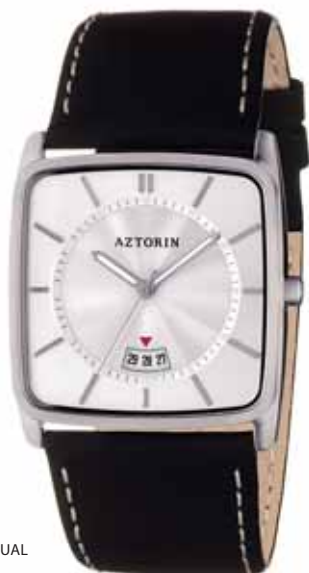
AZTORIN CASUAL A028.G096

Koperta stalowa o wymiarach 42 x 36,5 mm, wskazówkowy mechanizm kwarcowy, datownik, szkło szafirowe, pasek skórzany, wodoszczelność 30 m.