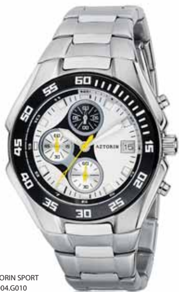
AZTORIN SPORT A004.G010

Koperta stalowa o średnicy 43 mm, wskazówkowy mechanizm kwarcowy, chronograf, datownik, szkło szafirowe, bransoleta stalowa, wodoszczelność do 100 m.