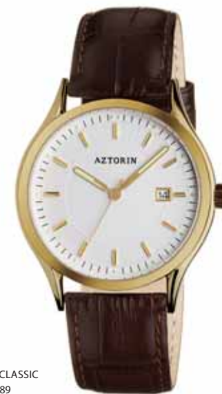
AZTORIN CLASSIC A027.G089

Koperta stalowa o średnicy 38,8 mm, pozłacana, wskazówkowy mechanizm kwarcowy, datownik, szkło szafirowe, pasek skórzany, wodoszczelność do 50 m.