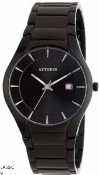
AZTORIN CLASSIC A014.G039

Koperta stalowa o średnicy 40 mm, czarna, wskazówkowy mechanizm kwarcowy, datownik, szkło szafirowe, bransoleta stalowa, czarna, wodoodporność do 100 m.