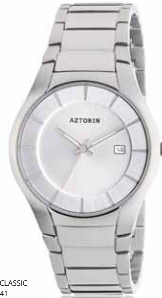
AZTORIN CLASSIC A014.G041

Koperta stalowa o średnicy 40 mm, wskazówkowy mechanizm kwarcowy, datownik, tarcza stalowa, szkło szafirowe, bransoleta stalowa, wodoszczelność do 100 m.