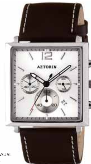
AZTORIN CASUAL A025.G084

Koperta stalowa o wymiarach 44 x 38 mm, wskazówkowy mechanizm kwarcowy, chronograf, datownik, szkło szafirowe, pasek skórzany, wodoszczelność do 30 m.