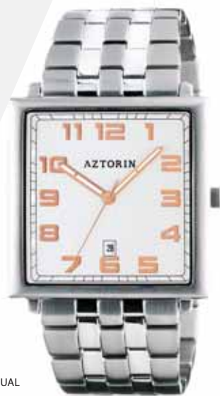
AZTORIN CASUAL A021.G067

Koperta stalowa o wymiarach 44 x 38 mm, wskazówkowy mechanizm kwarcowy, datownik, szkło szafirowe, bransoleta stalowa, wodoodporność do 30 m.