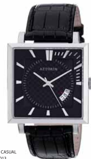
AZTORIN CASUAL A005.G013

Koperta stalowa o wymiarach 47 x 37,3 mm, wskazówkowy mechanizm kwarcowy, datownik, szkło szafirowe, pasek skórzany, wodoodporność do 30 m.