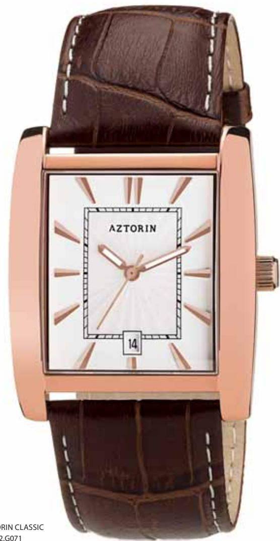
AZTORIN CLASSIC A022.G071

Koperta stalowa o wymiarach 41 x 34,5 mm, pozłacana, wskazówkowy mechanizm kwarcowy, datownik, szkło szafirowe, pasek skórzany, wodoszczelność do 30 m.