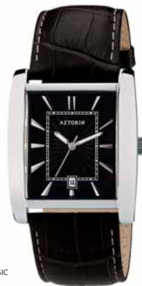
AZTORIN CLASSIC A022.G073

Koperta stalowa o wymiarach 41 x 34,5 mm, wskazówkowy mechanizm kwarcowy, datownik, szkło szafirowe, pasek skórzany, wodoszczelność do 30 m.