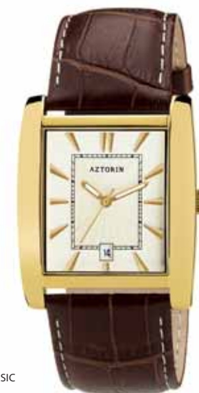
AZTORIN CLASSIC A022.G070

Koperta stalowa o wymiarach 41 x 34,5 mm, pozłacana, wskazówkowy mechanizm kwarcowy, datownik, szkło szafirowe, pasek skórzany, wodoszczelność do 30 m.