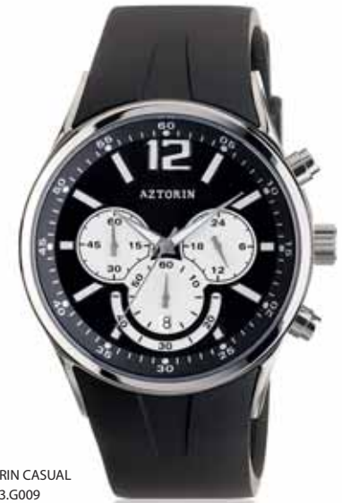
AZTORIN CASUAL A003.G009

Koperta stalowa o średnicy 43,6 mm, wskazówkowy mechanizm kwarcowy, chronograf, datownik, szkło szafirowe, pasek kauczukowy, wodoszczelność do 100 m.