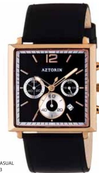
AZTORIN CASUAL A025.G083

Koperta stalowa o wymiarach 44 x 38 mm, pozłacana, wskazówkowy mechanizm kwarcowy, chronograf, datownik, szkło szafirowe, pasek skórzany, wodoszczelność do 30 m.