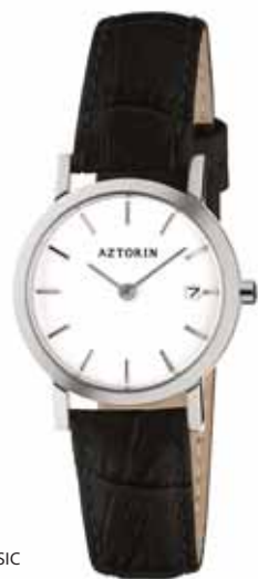
AZTORIN CLASSIC A023.L077

Zegarek damski, koperta stalowa o średnicy 27 mm, wskazówkowy mechanizm kwarcowy, datownik, szkło szafirowe, pasek skórzany, wodoszczelność do 30 m.