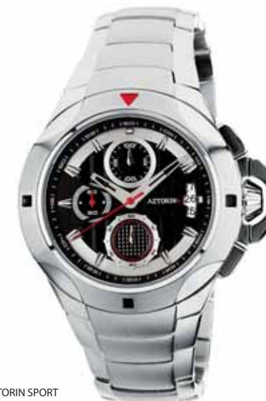
AZTORIN SPORT A017.G055

Koperta stalowa o średnicy 43 mm, wskazówkowy mechanizm kwarcowy, chronograf, datownik, szkło szafirowe, bransoleta stalowa, wodoodporność do 100 m.