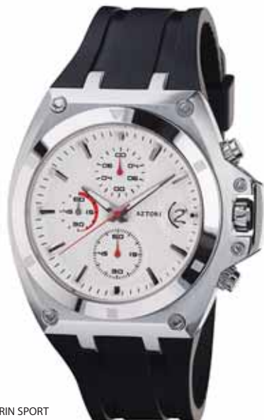
AZTORIN SPORT A015.G046

Koperta stalowa o średnicy 42 mm, wskazówkowy mechanizm kwarcowy, chronograf, datownik, szkło szafirowe, pasek kauczukowy, wodoodporność do 100 m.