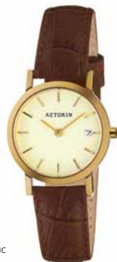
AZTORIN CLASSIC A023.L076

Zegarek damski, koperta stalowa o średnicy 27 mm, pozłacana, wskazówkowy mechanizm kwarcowy, datownik, szkło szafirowe, pasek skórzany, wodoszczelność do 30 m.