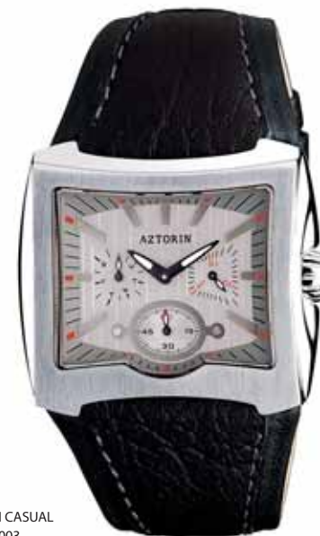
AZTORIN CASUAL A001.G003

Koperta stalowa o wymiarach 39,8 x 41,8 mm, wskazówkowy mechanizm kwarcowy, datownik, wskazania dni tygodnia, szkło szafirowe, pasek skórzany, wodoszczelność do 100 m.