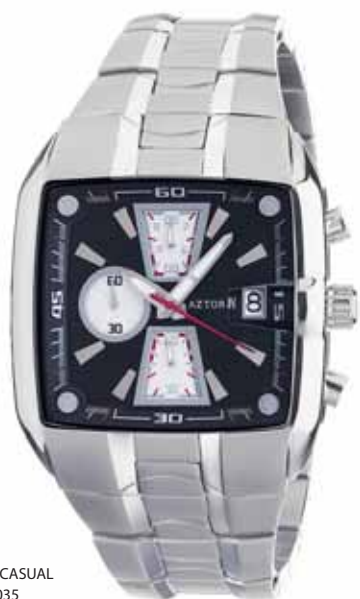
AZTORIN CASUAL A012.G035

Koperta stalowa o wymiarach 50 x 42 mm, wskazówkowy mechanizm kwarcowy, chronograf, datownik, szkło szafirowe, bransoleta stalowa, wodoszczelność do 100 m.