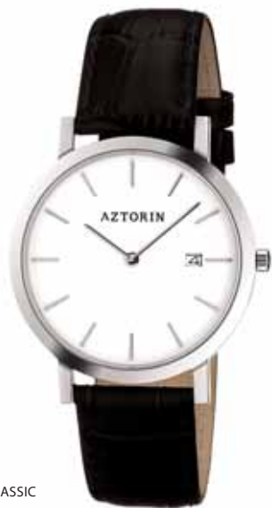
AZTORIN CLASSIC A023.G079

Koperta stalowa o średnicy 36,8 mm, wskazówkowy mechanizm kwarcowy, datownik, szkło szafirowe, pasek skórzany, wodoszczelność do 30 m.