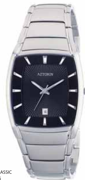
AZTORIN CLASSIC A009.G025

Koperta stalowa o wymiarach 42,5 x 34,4 mm, wskazówkowy mechanizm kwarcowy, datownik, szkło szafirowe, bransoleta stalowa, wodoodporność do 30 m.