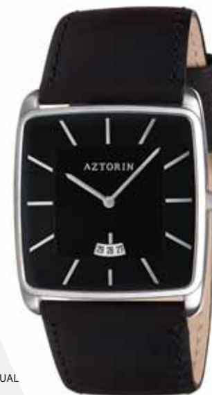
AZTORIN CASUAL A030.G105

Koperta stalowa o wymiarach 43,8 x 37 mm, wskazówkowy mechanizm kwarcowy, datownik, szkło szafirowe, pasek skórzany, wodoszczelność 30 m.