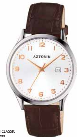
AZTORIN CLASSIC A026.G088

Koperta stalowa o średnicy 39,3 mm, wskazówkowy mechanizm kwarcowy, datownik, szkło szafirowe, pasek skórzany, wodoszczelność do 50 m.