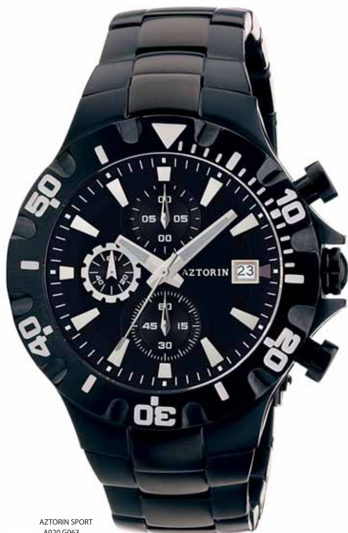
AZTORIN SPORT A020.G063

Koperta stalowa o średnicy 44 mm, czarna, wskazówkowy mechanizm kwarcowy, chronograf, datownik, szkło szafirowe, bransoleta stalowa, czarna, wodoszczelność do 100 m.