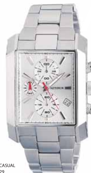
AZTORIN CASUAL A010.G029

Koperta stalowa o wymiarach 49,3 x 36 mm, wskazówkowy mechanizm kwarcowy, chronograf, datownik, szkło szafirowe, bransoleta stalowa, wodoszczelność do 100 m.