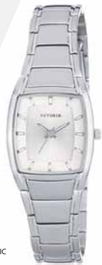
AZTORIN CLASSIC A009.L028

Zegarek damski, koperta stalowa o wymiarach 30,4 x 23,4 mm, wskazówkowy mechanizm kwarcowy, szkło szafirowe, bransoleta stalowa, wodoodporność do 30 m.