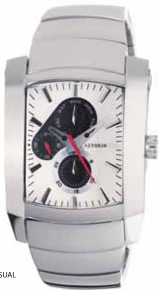
AZTORIN CASUAL A016.G048

Koperta stalowa o wymiarach 49,3 x 37 mm, wskazówkowy mechanizm kwarcowy, datownik, wskazania dni tygodnia, szkło szafirowe, bransoleta stalowa, wodoszczelność do 100 m.