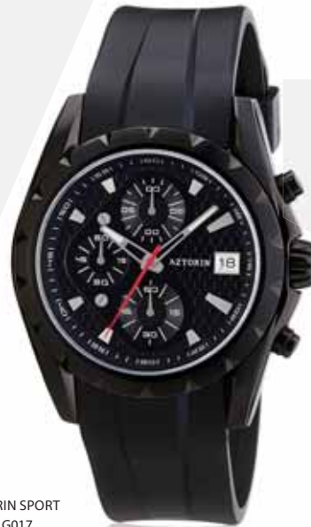
AZTORIN SPORT A006.G017

Koperta stalowa o średnicy 41,5 mm, czarna, wskazówkowy mechanizm kwarcowy, chronograf, datownik, szkło szafirowe, pasek kauczukowy, wodoszczelność do 100 m.