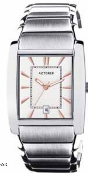
AZTORIN CLASSIC A022.G074

Koperta stalowa o wymiarach 41 x 34,5 mm, wskazówkowy mechanizm kwarcowy, datownik, szkło szafirowe, bransoleta stalowa, wodoszczelność do 30 m.