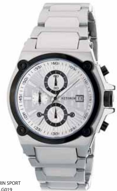
AZTORIN SPORT A007.G019

Koperta stalowa o średnicy 41 mm, wskazówkowy mechanizm kwarcowy, chronograf, datownik, szkło szafirowe, bransoleta stalowa, wodoszczelność do 100 m.