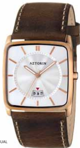
AZTORIN CASUAL A028.G094

Koperta stalowa o wymiarach 42 x 36,5 mm, pozłacana, wskazówkowy mechanizm kwarcowy, datownik, szkło szafirowe, pasek skórzany, wodoszczelność 30 m.