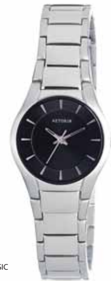
AZTORIN CLASSIC A014.L043

Zegarek damski, koperta stalowa o średnicy 26 mm, wskazówkowy mechanizm kwarcowy, szkło szafirowe, bransoleta stalowa, wodoodporność do 50 m.