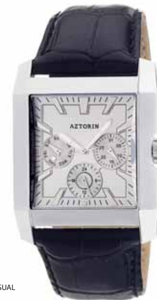
AZTORIN CASUAL A008.G021

Koperta stalowa o wymiarach 48,8 x 37 mm, wskazówkowy mechanizm kwarcowy, datownik, wskazania dni tygodnia, szkło szafirowe, pasek skórzany, wodoszczelność do 100 m.