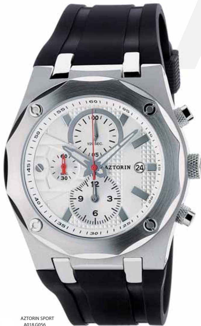
AZTORIN SPORT A018.G056

Koperta stalowa o średnicy 43 mm, wskazówkowy mechanizm kwarcowy, chronograf, datownik, szkło szafirowe, pasek kauczukowy, wodoszczelność do 100 m.