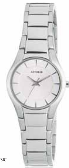
AZTORIN CLASSIC A014.L044

Zegarek damski, koperta stalowa o średnicy 26 mm, wskazówkowy mechanizm kwarcowy, tarcza stalowa, szkło szafirowe, bransoleta stalowa, wodoszczelność do 50 m.