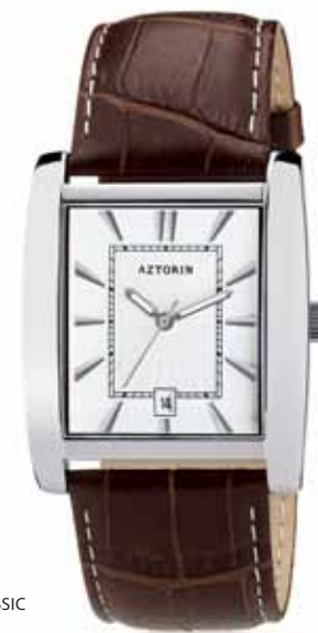
AZTORIN CLASSIC A022.G072

Koperta stalowa o wymiarach 41 x 34,5 mm, wskazówkowy mechanizm kwarcowy, datownik, szkło szafirowe, pasek skórzany, wodoszczelność do 30 m.