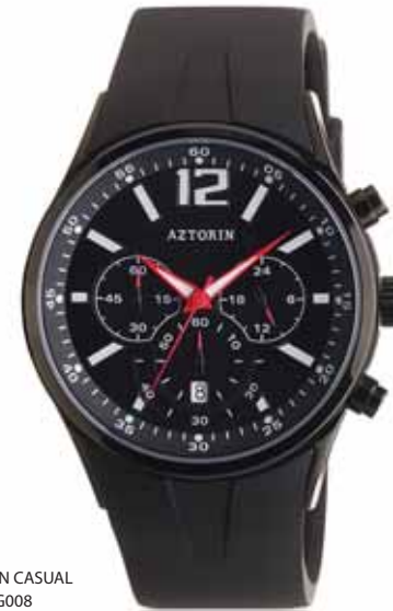
AZTORIN CASUAL A003.G008

Koperta stalowa o średnicy 43,6 mm, czarna, wskazówkowy mechanizm kwarcowy, chronograf, datownik, szkło szafirowe, pasek kauczukowy, wodoszczelność do 100 m.