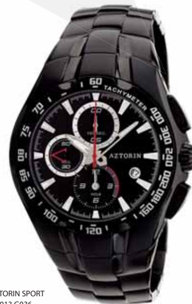
AZTORIN SPORT A013.G036

Koperta stalowa o średnicy 45,3 mm, czarna, wskazówkowy mechanizm kwarcowy, chronograf, datownik, szkło szafirowe, bransoleta stalowa, czarna, wodoszczelność do 100 m.