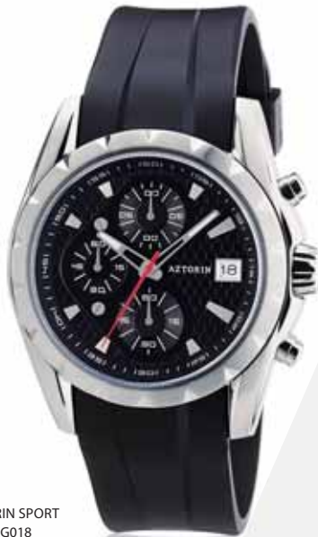
AZTORIN SPORT A006.G018

Koperta stalowa o średnicy 41,5 mm, wskazówkowy mechanizm kwarcowy, chronograf, datownik, szkło szafirowe, pasek kauczukowy, wodoszczelność do 100 m.