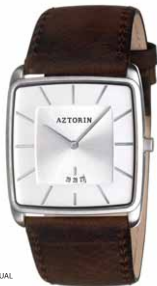
AZTORIN CASUAL A030.G104

Koperta stalowa o wymiarach 43,8 x 37 mm, wskazówkowy mechanizm kwarcowy, datownik, szkło szafirowe, pasek skórzany, wodoszczelność 30 m.