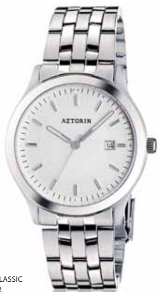
AZTORIN CLASSIC A027.G092

Koperta stalowa o średnicy 38,8 mm, wskazówkowy mechanizm kwarcowy, datownik, szkło szafirowe, bransoleta stalowa, wodoszczelność do 50 m.