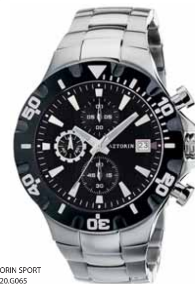
AZTORIN SPORT A020.G065

Koperta stalowa o średnicy 44 mm, pierścień czarny, wskazówkowy mechanizm kwarcowy, chronograf, datownik, szkło szafirowe, bransoleta stalowa, wodoszczelność do 100 m.