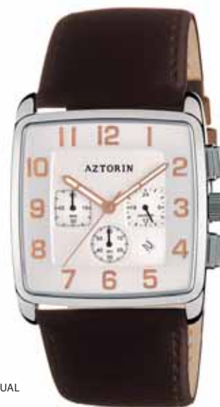
AZTORIN CASUAL A029.G098

Koperta stalowa o wymiarach 43,8 x 37 mm, wskazówkowy mechanizm kwarcowy, datownik, chronograf, szkło szafirowe, pasek satynowy, wodoszczelność do 30 m.