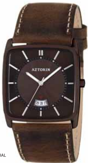
AZTORIN CASUAL A028.G095

Koperta stalowa o wymiarach 42 x 36,5 mm, brązowa, wskazówkowy mechanizm kwarcowy, datownik, szkło szafirowe, pasek skórzany, wodoszczelność 30 m.