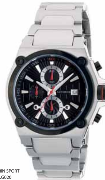
AZTORIN SPORT A007.G020

Koperta stalowa o średnicy 41 mm, wskazówkowy mechanizm kwarcowy, chronograf, datownik, szkło szafirowe, bransoleta stalowa, wodoszczelność do 100 m.