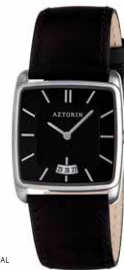
AZTORIN CASUAL A030.L103

Zegarek damski, koperta stalowa o wymiarach 36,5 x 30 mm, wskazówkowy mechanizm kwarcowy, datownik, szkło szafirowe, pasek skórzany, wodoszczelność 30 m.