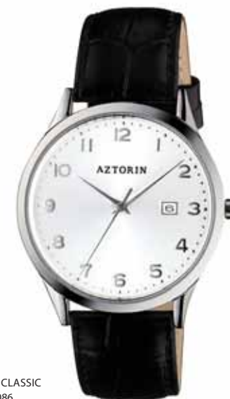
AZTORIN CLASSIC A026.G086

Koperta stalowa o średnicy 39,3 mm, wskazówkowy mechanizm kwarcowy, datownik, szkło szafirowe, pasek skórzany, wodoszczelność do 50 m.