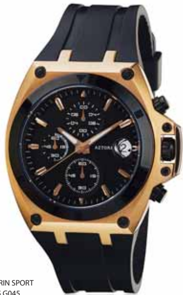
AZTORIN SPORT A015.G045

Koperta stalowa pozłacana o średnicy 42 mm, wskazówkowy mechanizm kwarcowy, chronograf, datownik, szkło szafirowe, pasek kauczukowy, wodoodporność do 100 m.