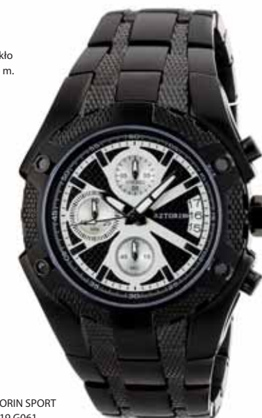
AZTORIN SPORT A019.G061

Koperta stalowa o średnicy 43 mm, czarna, wskazówkowy mechanizm kwarcowy, chronograf, datownik, szkło szafirowe, bransoleta stalowa, czarna, wodoszczelność do 100 m.