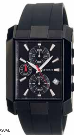
AZTORIN CASUAL A010.G030

Koperta stalowa o wymiarach 49,3 x 36 mm, wskazówkowy mechanizm kwarcowy, chronograf, datownik, szkło szafirowe, pasek kauczukowy, wodoszczelność do 100 m.