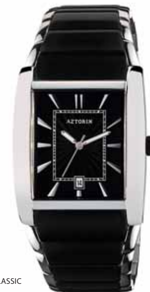
AZTORIN CLASSIC A022.G075

Koperta stalowa o wymiarach 41 x 34,5 mm, wskazówkowy mechanizm kwarcowy, datownik, szkło szafirowe, bransoleta stalowa, czarna, wodoszczelność do 30 m.