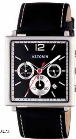
AZTORIN CASUAL A025.G085

Koperta stalowa o wymiarach 44 x 38 mm, wskazówkowy mechanizm kwarcowy, chronograf, datownik, szkło szafirowe, pasek skórzany, wodoszczelność do 30 m.