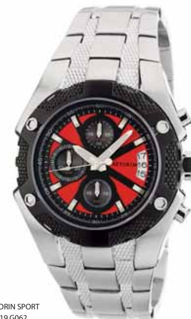
AZTORIN SPORT A019.G062

Koperta stalowa o średnicy 43 mm, pierścieni czarny, wskazówkowy mechanizm kwarcowy, chronograf, datownik, szkło szafirowe, bransoleta stalowa, wodoszczelność do 100 m.