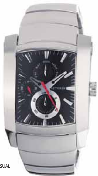
AZTORIN CASUAL A016.G049

Koperta stalowa o wymiarach 49,3 x 37 mm, wskazówkowy mechanizm kwarcowy, datownik, wskazania dni tygodnia, szkło szafirowe, bransoleta stalowa, wodoszczelność do 100 m.