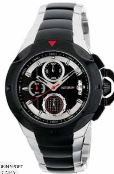
AZTORIN SPORT A017.G053

Koperta stalowa o średnicy 43 mm, czarna, wskazówkowy mechanizm kwarcowy, chronograf, datownik, szkło szafirowe, bransoleta stalowa, wodoodporność do 100 m.