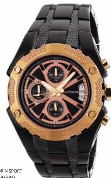
AZTORIN SPORT A019.G060

Koperta stalowa o średnicy 43 mm, czarna, pierścieni pozłacany, wskazówkowy mechanizm kwarcowy, chronograf, datownik, szkło szafirowe, bransoleta stalowa, czarna, wodoszczelność do 100 m.