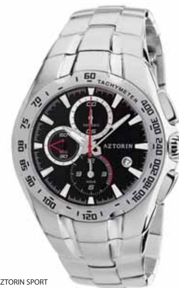
AZTORIN SPORT A013.G038

Koperta stalowa o średnicy 45,3 mm, wskazówkowy mechanizm kwarcowy, chronograf, datownik, szkło szafirowe, bransoleta stalowa, wodoszczelność do 100 m.