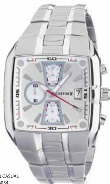
AZTORIN CASUAL A012.G034

Koperta stalowa o wymiarach 50 x 42 mm, wskazówkowy mechanizm kwarcowy, chronograf, datownik, szkło szafirowe, bransoleta stalowa, wodoszczelność do 100 m.