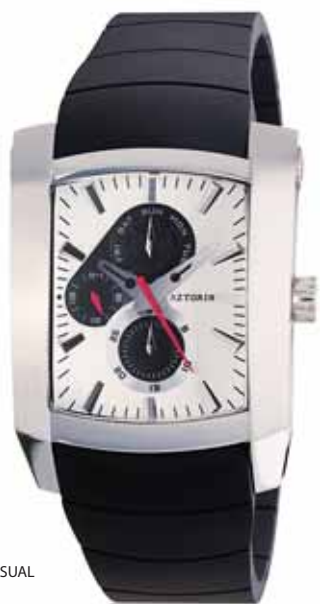
AZTORIN CASUAL A016.G051

Koperta stalowa o wymiarach 49,3 x 37 mm, wskazówkowy mechanizm kwarcowy, datownik, wskazania dni tygodnia, szkło szafirowe, pasek kauczukowy, wodoszczelność do 100 m.