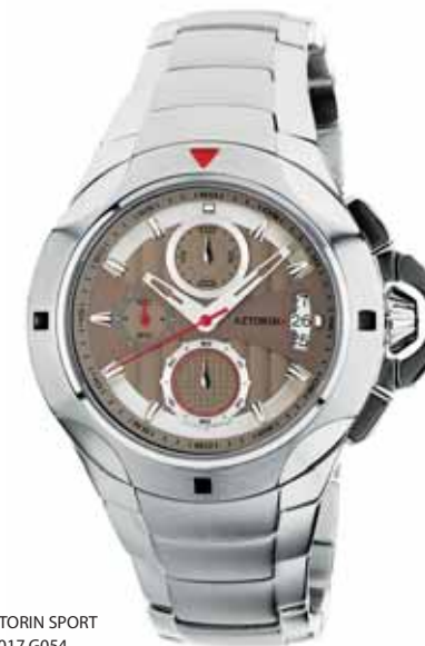
AZTORIN SPORT A017.G054

Koperta stalowa o średnicy 43 mm, wskazówkowy mechanizm kwarcowy, chronograf, datownik, szkło szafirowe, bransoleta stalowa, wodoodporność do 100 m.