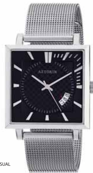
AZTORIN CASUAL A005.G016

Koperta stalowa o wymiarach 47 x 37,3 mm, wskazówkowy mechanizm kwarcowy, datownik, szkło szafirowe, bransoleta stalowa, wodoodporność do 30 m.