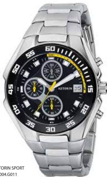
AZTORIN SPORT A004.G011

Koperta stalowa o średnicy 43 mm, wskazówkowy mechanizm kwarcowy, chronograf, datownik, szkło szafirowe, bransoleta stalowa, wodoszczelność do 100 m.