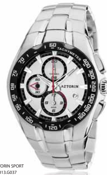
AZTORIN SPORT A013.G037

Koperta stalowa o średnicy 45,3 mm, wskazówkowy mechanizm kwarcowy, chronograf, datownik, szkło szafirowe, bransoleta stalowa, wodoszczelność do 100 m.