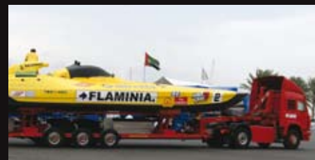
Łodzie Class 1 mierzą około 14 m i ważą niemal 5 ton.