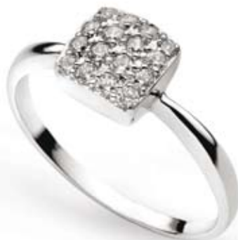
PIERŚCIONEK cyrkonie, złoto pr. 585. Cena: 449 zł

W salonach Apart, Panie znajdą wiele wzorów biżuterii złotej, należącej do klasyki gatunku. Eleganckie komplety stanowią idealną ozdobę dla kobiety ceniącej w biżuterii subtelność i ponadczasowy charakter. Złote dodatki często wysadzane są cyrkoniami, które błyszczą delikatnie przy każdym odbiciu światła. To biżuteria, która była, jest i będzie modna.