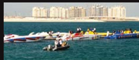
Łodzie tuż po zawodach na tle wybrzeża Dubaju.

Pomiar czasu na zawodach Class 1 odbywa się za pomocą zegarów Edox. Ułamki sekund decydujące o zwycięstwie wymagają niezwyklej precyzji pomiaru.