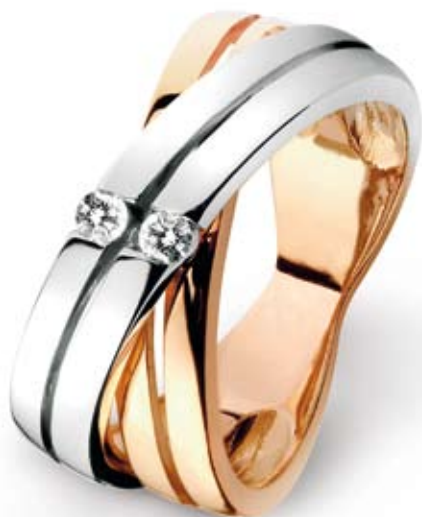
PIERŚCIONEK wzór 804, brylanty 2 szt. – 0,10 ct, złoto pr. 585. Cena: 1.649 zł