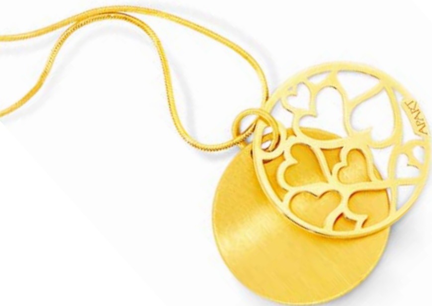
ZAWIESZKA złoto pr. 585. Cena: 359 zł