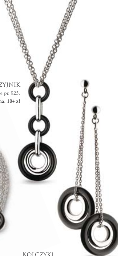
KOLCZYKI srebro rodowane pr. 925. Cena: 64 zł