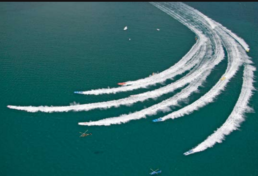
Walka łodzi o zwycięstwo w wyścigu do mety.

01104 TIN NIN, koperta tytanowa, mechanizm automatyczny z funkcją chronografu, szafirowe szkło z wewnętrzną powłoką antyrefleksyjną, zawór helowy, kauczukowy pasek, dodatkowa wymienna bransoleta z przyrządem do wymiany paska, wodoszczelność 500 m. Cena: 7 390 zł