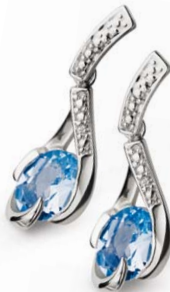
KOLCZYKI wzór 169, brylanty 2 szt. – 0,01 ct, topaz, złoto pr. 585. Cena: 559 zł

Biżuteria z topazem dostępna w wybranych salonach Apart.