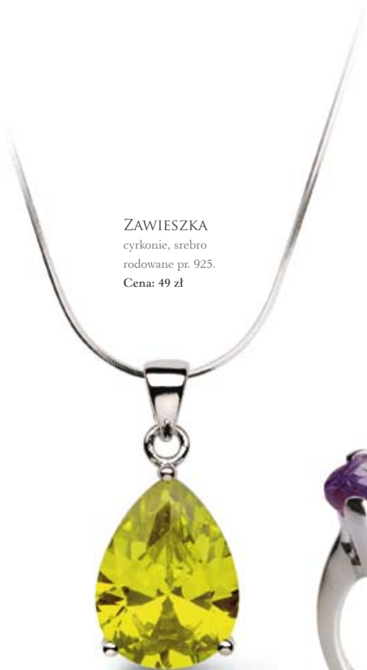
ZAWIESZKA cyrkonie, srebro rodowane pr. 925. Cena: 49 zł