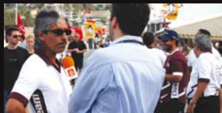
Dziennikarze przeprowadzający wywiady z zawodnikami, tłumy widzów – atmosfera zawodów Class 1.