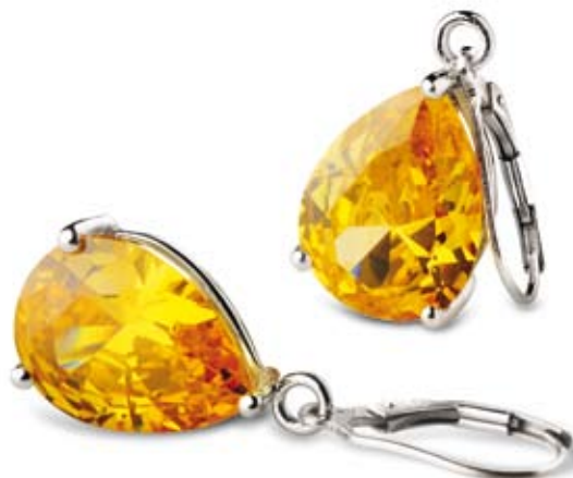
KOLCZYKI cyrkonie, srebro rodowane pr. 925. Cena: 94 zł