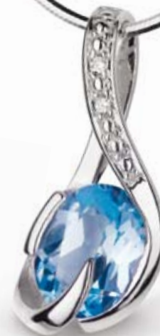
ZAWIESZKA wzór 172, brylanty 2 szt. – 0,01 ct, topaz, złoto pr. 585. Cena: 319 zł