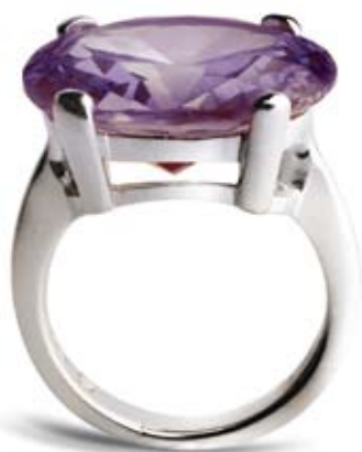
PIERŚCIONEK cyrkonie, srebro rodowane pr. 925. Cena: 79 zł

Osadzone w srebrze okazałe cyrkonie, przesadzone, błyszczące i bardzo wyraziste, wspaniale wpisują się we współczesny styl glamour. Wiosna to taka pora roku, która aż prosi o odrobinę szaleństwa i fantazji, dlatego poddajmy się jej urokowi i nośmy kolorową biżuterię, która wprowadzi nas w optymistyczny nastrój i wywoła uśmiech za każdym razem, gdy spojrzymy w lustro.