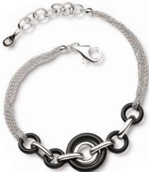
NASZYJNIK srebro rodowane pr. 925. Cena: 104 zł