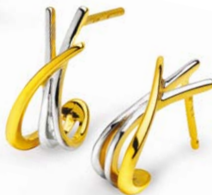
KOLCZYKI złoto pr. 585. Cena: 302 zł