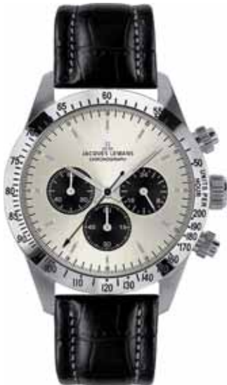
JACQUES LEMANS zegarek męski, nr ref. N-1557B