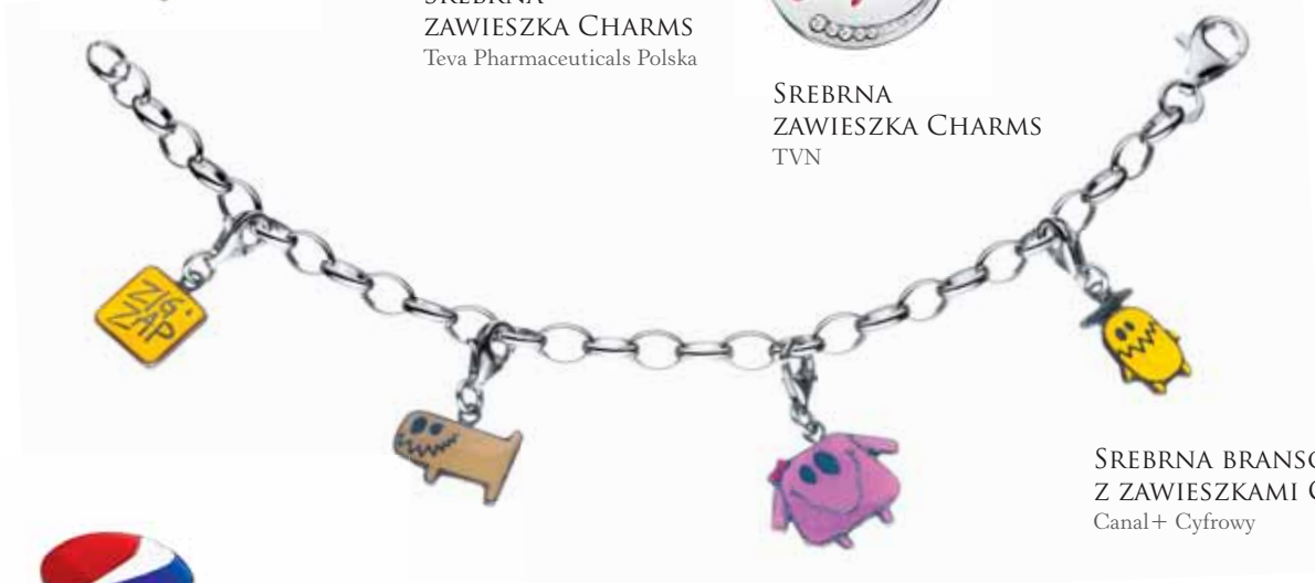
SREBRNA BRANSOLETKA Z ZAWIESZKAMI CHARMS Canal+ Cyfrowy