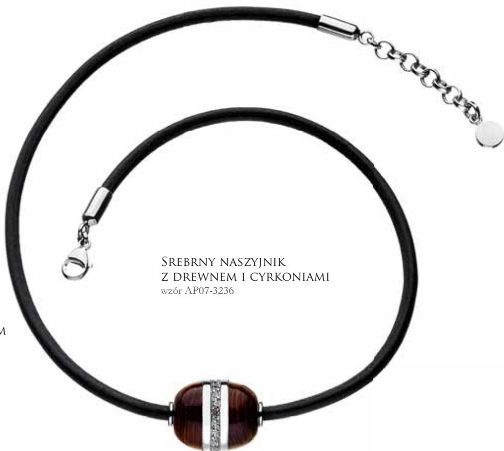
SREBRNY NASZYJNIK Z DREWNIEM I CYRKONIAMI wzór AP07-3236