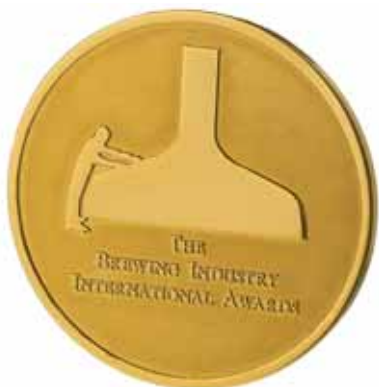
ZŁOTY MEDAL Kompania Piwowarska

SĄ OKAZJE, KTÓRE WYMAGAJĄ WYJĄTKOWEJ OPRAWY. ICH RANGĘ Z PEWNOŚCIĄ PODNIOŚĄ SPECJALNIE ZAPROJEKTOWANE I WYKONANE STATUETKI CZY ODZNACZENIA. PRZY REALIZACJI TEGO TYPU ZAMÓWIEŃ APART CZERPIE Z OGROMNEGO DOŚWIADCZENIA W TWORZENIU STATUETEK DLA NAJWAŻNIEJSZYCH WYDARZEŃ ŚWIATA BIZNESU, MEDIÓW I MODY W POLSCE. DO GRONA KLIENTÓW APART ZALICZA SIĘ TAKŻE WIELE ZNANYCH I CENIONYCH FIRM, NA KTÓRYCH ZLECENIE W PRACOWNIACH APART POWSTAWAŁY NAGRODY UZNANIA, MEDALE OKOLICZNOŚCIOWE ORAZ STATUETKI.