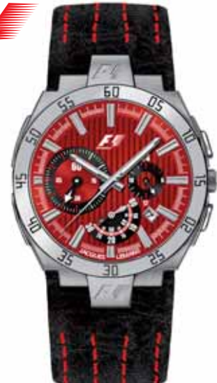
JACQUES LEMANS F1 zegarek męski, nr ref. F-5044E F1