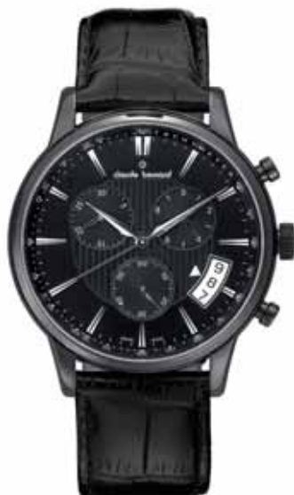
CLAUDE BERNARD zegarek męski, nr ref. 01002 37N NIN