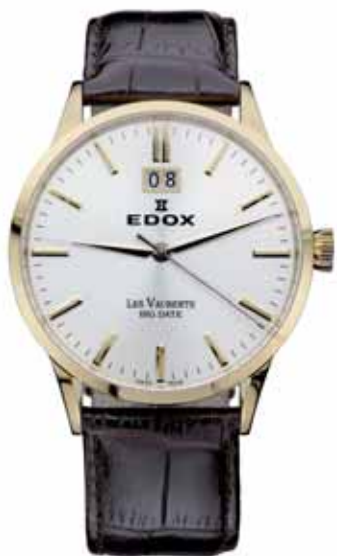
EDOX LES VAUBERTS zegarek męski, nr ref. 63001 37R AIR

ZEGAREK POTRAFI WIELE POWIEDZIEĆ O OSOBIE, KTÓRA GO NOSI. JEST ELEMENTEM UZUPEŁNIAJĄCYM JEJ WIZERUNEK. RÓWNIEŻ FIRMA CZY INSTYTUCJA OFIARUJĄCA ZEGAREK BĘDZIE POSTRZEGANA PRZEZ PRYZMAT TEGO DODATKU. IMPONUJĄCY KATALOG CZASOMIERZY OFEROWANYCH W APART POZWALA DOPASOWAĆ ODPOWIEDNI MODEL DO TOŻSAMOŚCI KAŻDEJ MARKI. ZEGAREK, OPRÓCZ SWOISTEJ WARTOŚCI, MOŻE RÓWNIEŻ ZYSKAĆ DODATKOWY WALOR W POSTACI DYSKRETNEGO GRAWERUNKU NA TARCZY, DEKLU, PASKU LUB OPAKOWANIU.