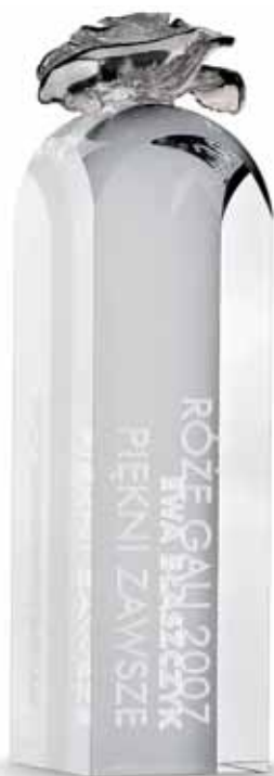
STATUETKA plebiscyt „Róże Gali”