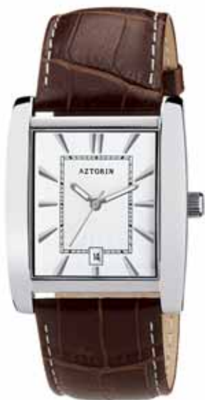
AZTORIN CLASSIC zegarek męski, nr ref. A022.G072