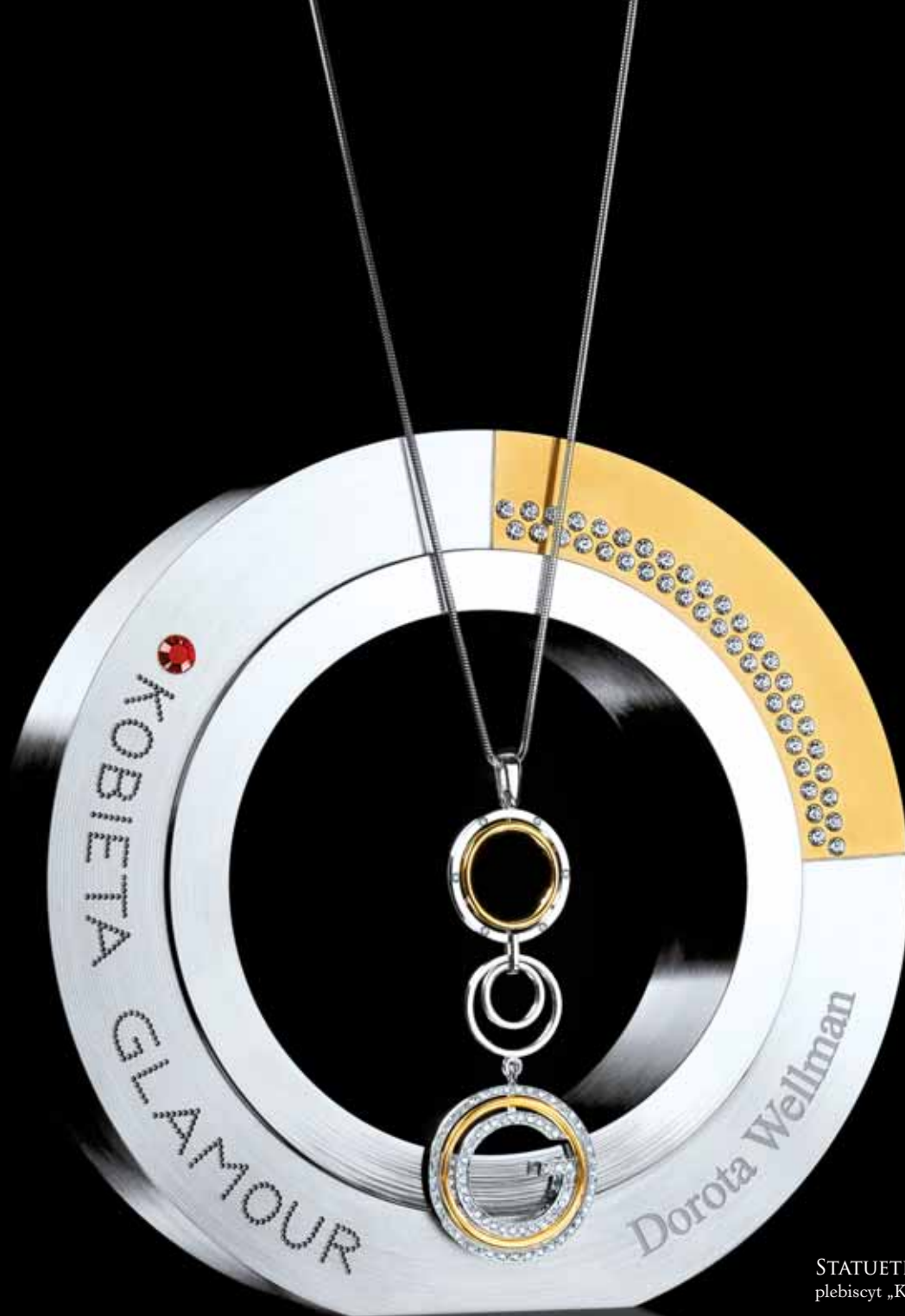
STATUETKA plebiscyt „Kobieta Glamour”