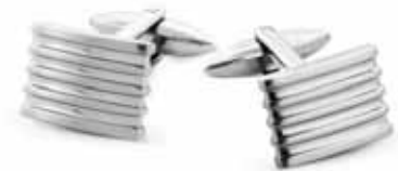
SPINKI ZE STALI SZLACHETNEJ wzór AP10-250