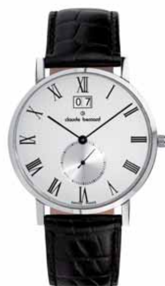
CLAUDE BERNARD zegarek męski, nr ref. 64006 3 BR