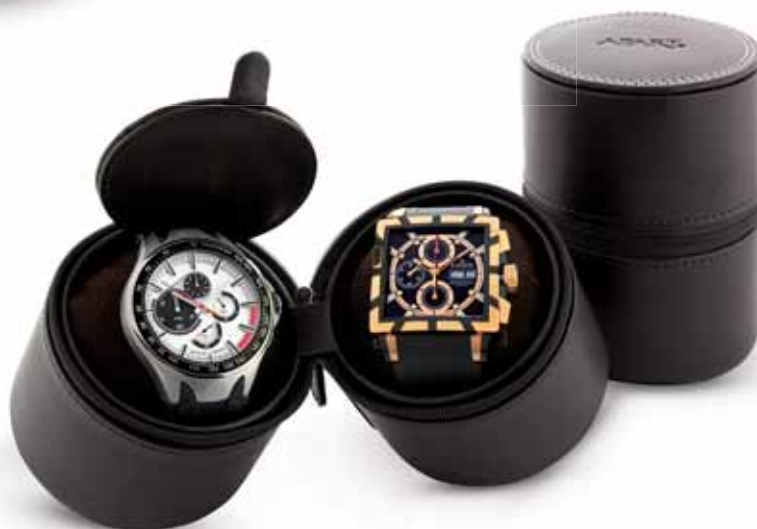
ETUI NA ZEGAREK AP55-019