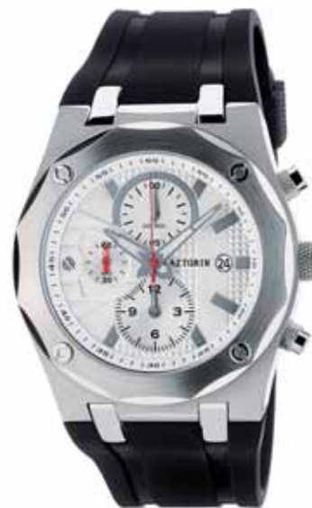
AZTORIN CLASSIC zegarek męski, nr ref. A018.G056