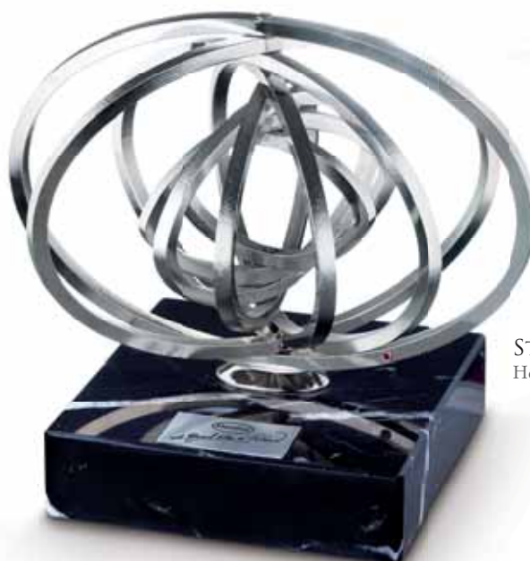
STATUETKA Henkel Polska