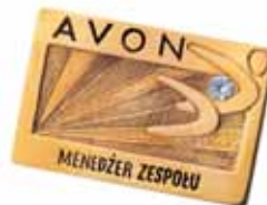
POZŁACANY PINS Avon Cosmetics Polska