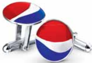
SREBNE SPINKI Pepsi-Cola General Bottlers Poland