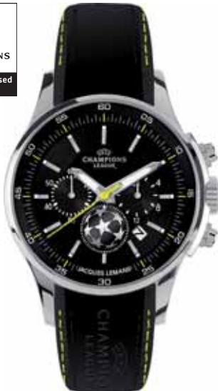
JACQUES LEMANS UEFA CHAMPIONS LEAGUE zegarek męski, nr ref. U-32A