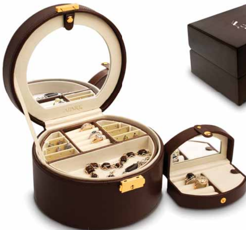
KUFEREK NA BIŻUTERIĘ AP55-001-II

OFERTA APART OBEJMUJE PEŁNĄ GAMĘ OPAKOWAŃ I KUFERKÓW – OD WZORÓW STANDARDOWYCH DO NAJBARDZIEJ EKSKLUZYWNYCH. DOSTĘPNE SĄ ONE W RÓŻNYCH ROZMIARACH I KOLORACH, DZIĘKI CZEMU Z ŁATWOŚCIĄ MOŻNA JE DOPASOWAĆ DO ZEGARKÓW I BIŻUTERII, A TAKŻE INDYWIDUALNYCH POTRZEB KLIENTA. ATRAKCYJNE OPAKOWANIE DODAJE UPOMINKOWI NIEPOWTARZALNEGO UROKU. OKOLICZNOŚCIOWY GRAWERUNEK LUB NADRUK MOŻE JESZCZE DOBITNIEJ PODKREŚLIĆ WYJĄTKOWY CHARAKTER PODARUNKU.