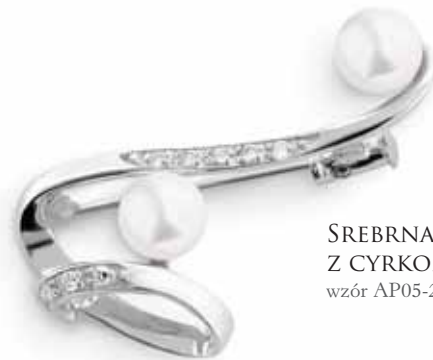
SREBRNA BROSZKA Z CYRKONIAM I PERŁAMI wzór AP05-225