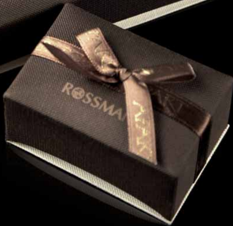
OPAKOWANIE NA BIŻUTERIĘ Z PERSONALIZACJĄ Rossmann