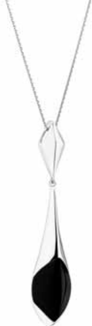
SREBRNA ZAWIESZKA Z AGATEM wzór AP04-5288