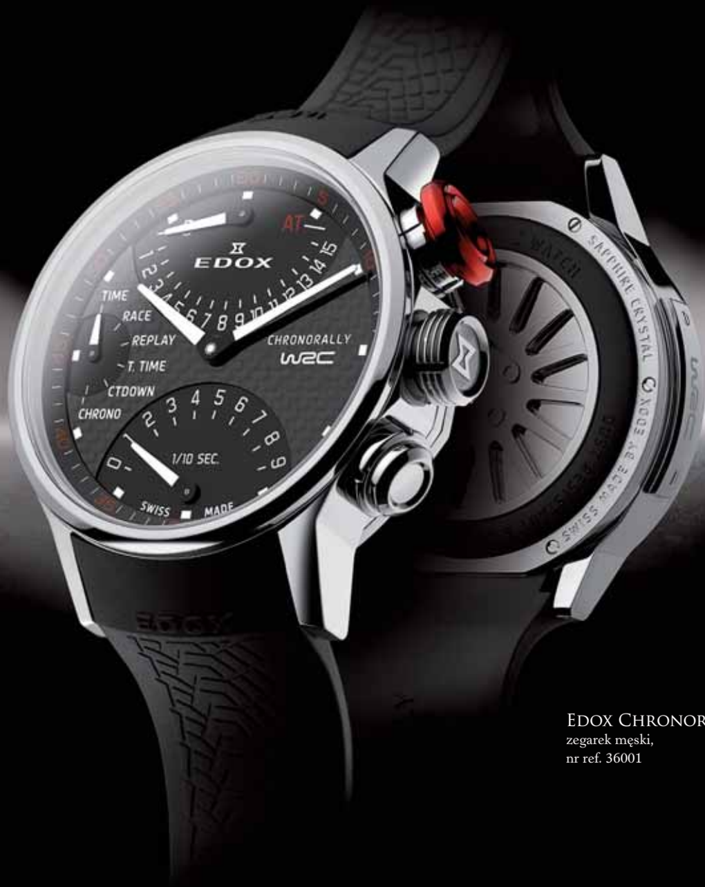
EDOX CHRONORALLY zegarek męski, nr ref. 36001