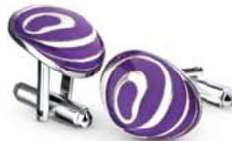
SREBNE SPINKI P4