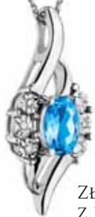
ZŁOTA ZAWIESZKA Z DIAMENTAMI I TOPAZEM wzór 111.152

SZEROKI ASORTYMENT BIŻUTERII: SREBRNEJ, ZŁOTEJ, Z DIAMENTAMI, BURSZTYNAMI, PERŁAMI CZY TEŻ KOLOROWYMI KAMIENIAMI SZLACHETNYMI, ZASPOKOI KAŻDE WYMAGANIA. ZAKUP KILKUDZIESIĘCIU PRODUKTÓW Z DIAMENTAMI W CELU UHONOROWANIA NAJLEPSZYCH PARTNERÓW BIZNESOWYCH, KILKuset ZAWIESZEK KOLORYSTYCZNIE ZGODNYCH Z IDENTYFIKACJĄ WIZUALNĄ FIRMY, KILKU TYSIĘCY SREBRNYCH KOLCZYKÓW, KTÓRE BĘDĄ DOSTĘPNE W OGÓLNOKRAJOWEJ PROMOCJI – MOŻLIWA JEST REALIZACJA DOWOLNEGO ZAMÓWIENIA, WSZYSTKO ZALEŻY OD BUDŻETU I SKALI POTRZEB KLIENTA.