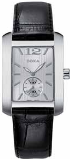
DOXA STYLE zegarek męski, nr ref. 243.10.023.01