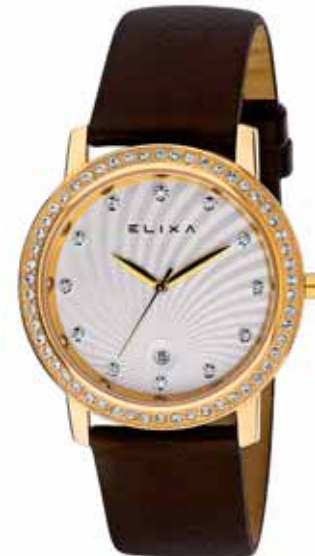
ELIXA zegarek damski, nr ref. E044-L138