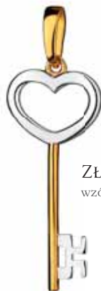
ZŁOTA ZAWIESZKA wzór AP03-0730