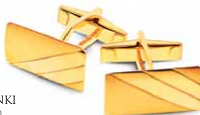
ZŁOTE SPINKI wzór AP10-040