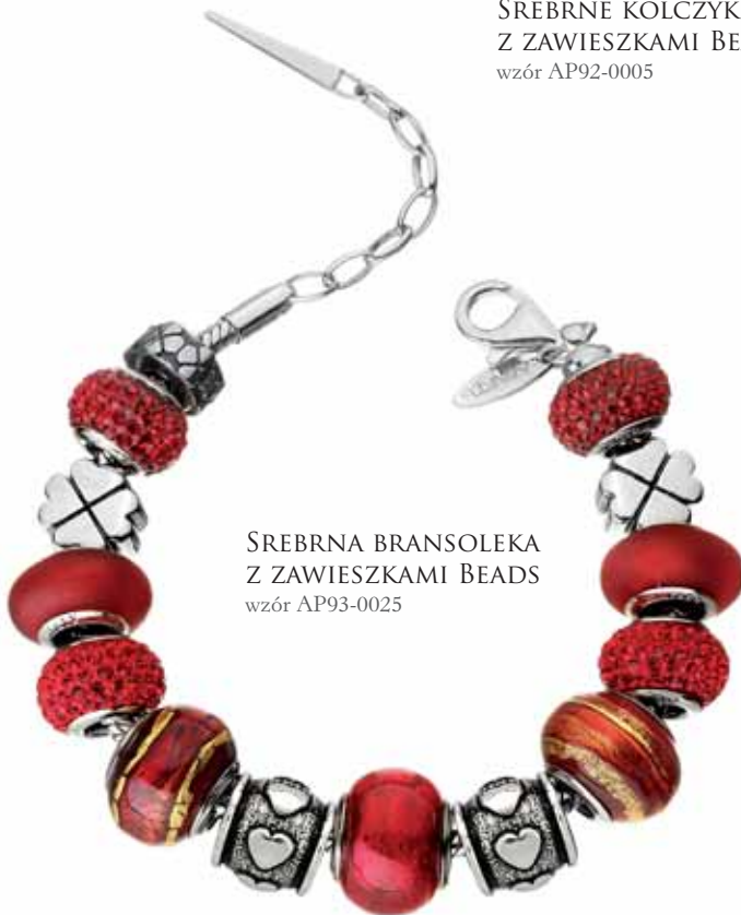
SREBRNA BRANSOLEKA Z ZAWIESZKAMI BEADS wzór AP93-0025