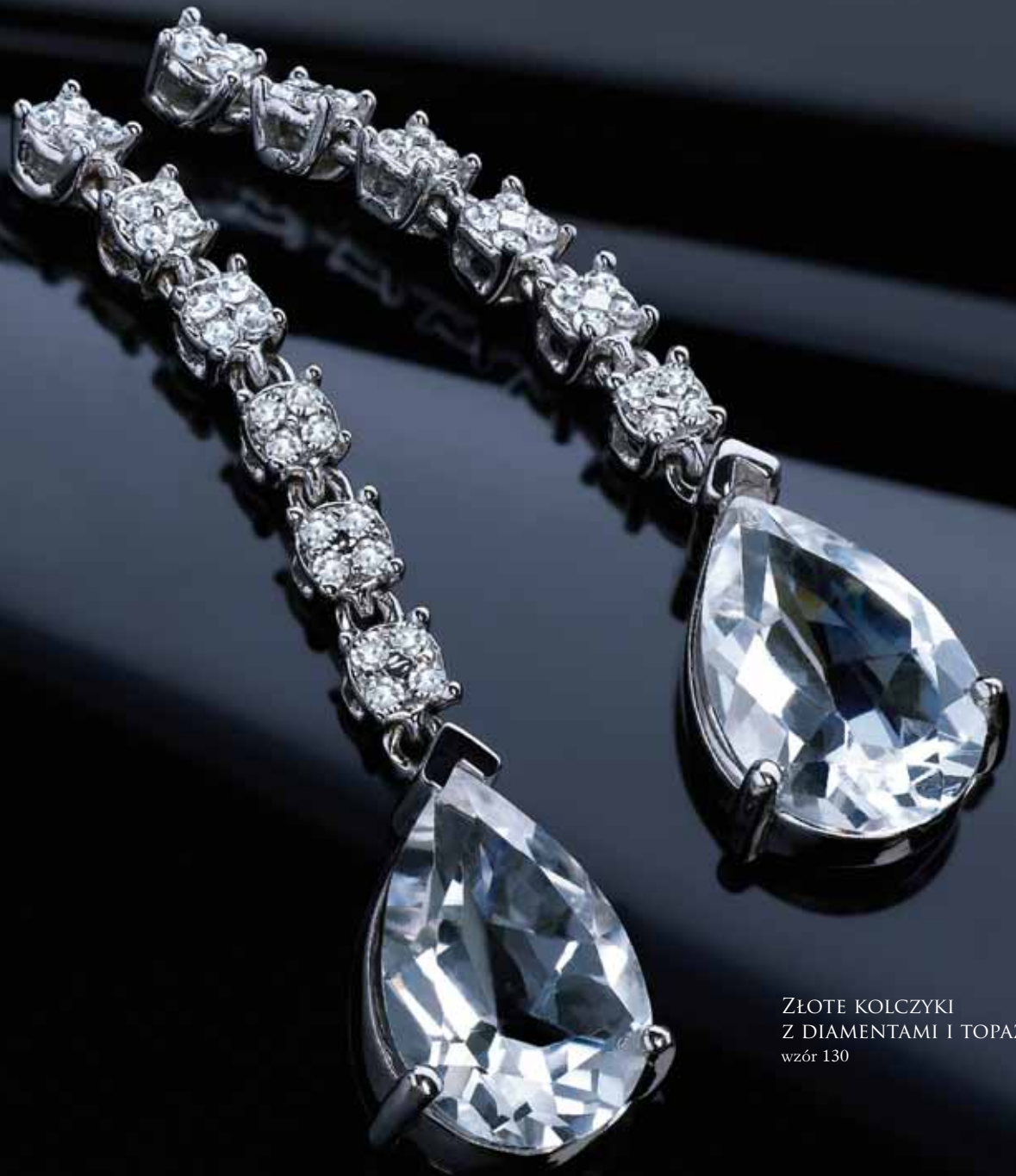
ZŁOTE KOLCZYKI Z DIAMENTAMI I TOPAZAMI wzór 130