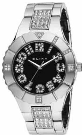
ELIXA zegarek damski, nr ref. E030-L097