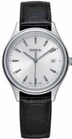
DOXA TRADITION zegarek męski, nr ref. 211.10.021.01