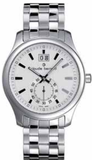
CLAUDE BERNARD zegarek męski, nr ref. 64003 3 AIN