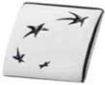
SREBRNY PINS BNP Paribas Fortis

BIŻUTERIA PROJEKTOWANA NA SPECJALNE ZAMÓWIENIE KLIENTA POZWALA W NIEZWYKLE ELEGANCKI SPOSÓB PODKREŚLIĆ WYJĄTKOWOŚĆ I PRESTIŻ FIRMY, MARKI, WYDARZENIA. PRODUKTY TWORZONE SĄ OD PODSTAW W PRACOWNIACH APART W OPARCIU O PRZEDSTAWIONE PRZEZ KLIENTA OCZEKIWANIA I CELE. KAŻDY PROJEKT JEST REALIZOWANY CAŁKOWICIE INDYWIDUALNIE, CO GWARANTUJE STUPROCENTOWĄ ORYGINALNOŚĆ I UNIKATOWOŚĆ WZORU.