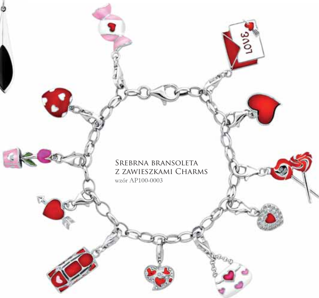
SREBRNA BRANSOLETA Z ZAWIESZKAMI CHARMS wzór AP100-0003