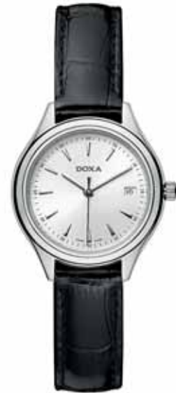
DOXA TRADITION zegarek damski, nr ref. 211.15.021.01