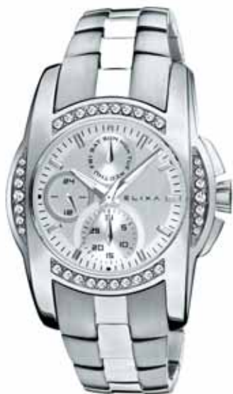
ELIXA zegarek damski, nr ref. E008-L028