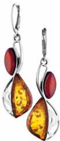
SREBRNE KOLCZYKI Z BURSZTYNAMI wzór AP32-3050