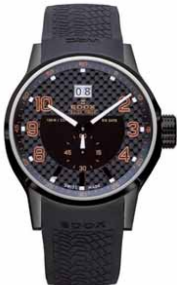
EDOX WRC zegarek męski, nr ref. 64008 37N NOR