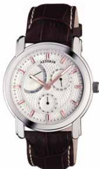
AZTORIN CLASSIC zegarek męski, nr ref. A024.G081