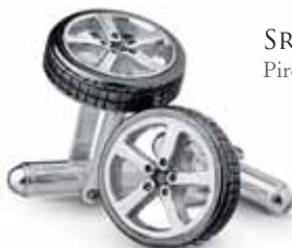
SREBNE SPINKI Pirelli