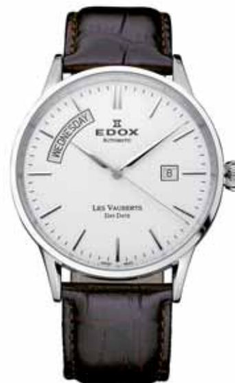
EDOX LES VAUBERTS zegarek męski, nr ref. 83007 3 AIN