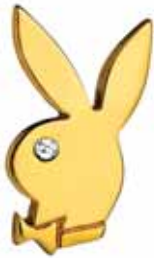
ZŁOTY PINS Playboy Polska