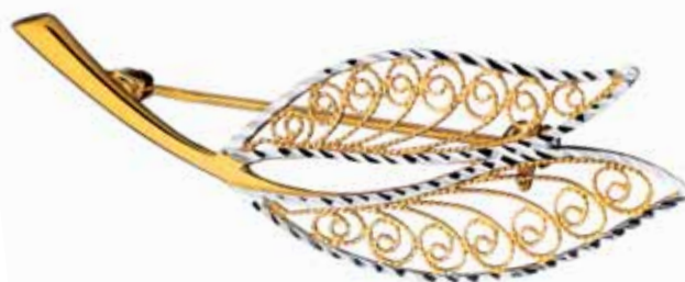
ZŁOTA BROSZKA wzór AP03-0055