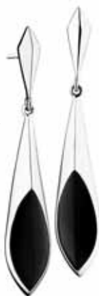
SREBRNE KOLCZYKI Z AGATEM wzór AP53-3829