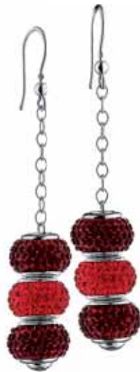
SREBRNE KOLCZYKI Z ZAWIESZKAMI BEADS wzór AP92-0005