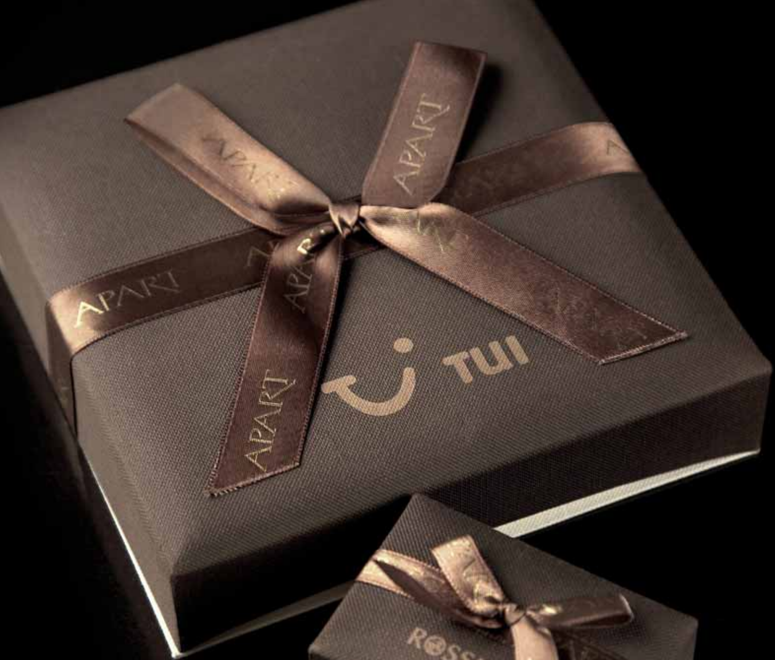
OPAKOWANIE NA BIŻUTERIĘ Z PERSONALIZACJĄ Tui Poland