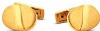
ZŁOTE SPINKI wzór AP10-044