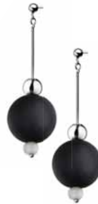
SREBRNE KOLCZYKI ZE SZKŁEM MURANO wzór AP53-3870