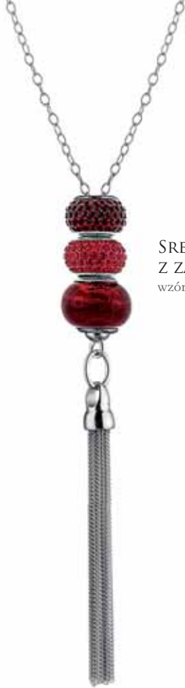
SREBRNY NASZYJNIK Z ZAWIESZKAMI BEADS wzór AP91-0005