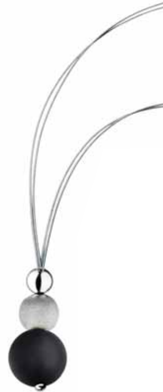
SREBRNY NASZYJNIK ZE SZKŁEM MURANO wzór AP07-3340