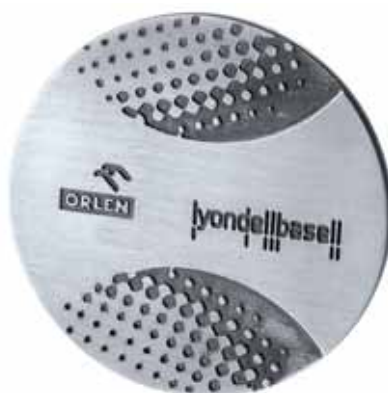
SREBRNY MEDAL Orlen