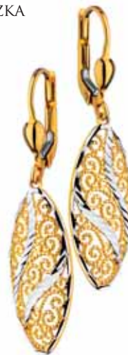
ZŁOTE KOLCZYKI wzór AP23-0778