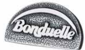
SREBRNY PINS Bonduelle Polska