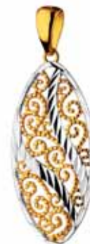
ZŁOTA ZAWIESZKA wzór AP03-0745