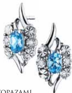
ZŁOTE KOLCZYKI Z DIAMENTAMI I TOPAZAMI wzór 111.152