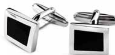
SREBRNE SPINKI Z ONYKSEM wzór AP10-270